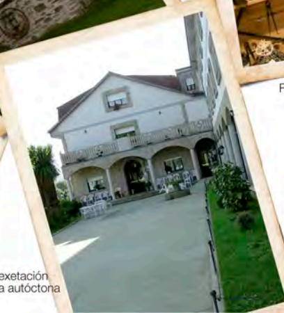
Hotel Balneario Baños da Brea