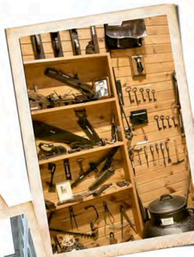
Fundación Neira Vilas